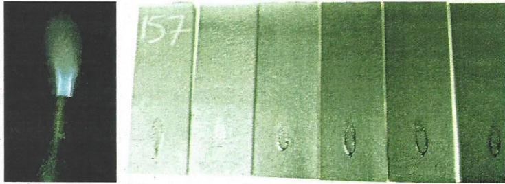
Resim 1: Deney işlemi esnasında ve sonrasında çekilen fotoğraflar

"Bu deney sonucu, deneyin uygulandığı özel şartlar altında bir mamulün deney numunesinin davranışıyla ilgilidir; gerçek kullanım şartlarındaki bir mamulün potansiyel yangın tehlikesinin değerlendirilmesi için yegâne bir kriterle ilgili değildir."